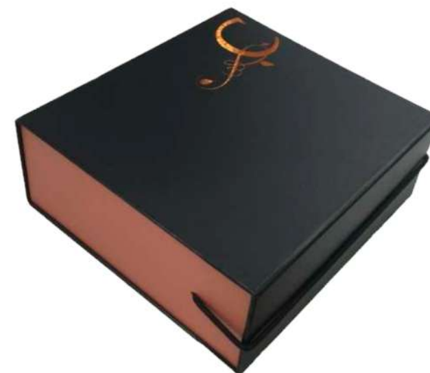
Cajas regalo cierre con imán y goma elástica

Le mostramos una pequeña selección, siempre que lo necesite podemos modificar, eliminar o añadir productos.